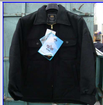
Giacca Marina CPO Navy Wool Jacket Made in USA